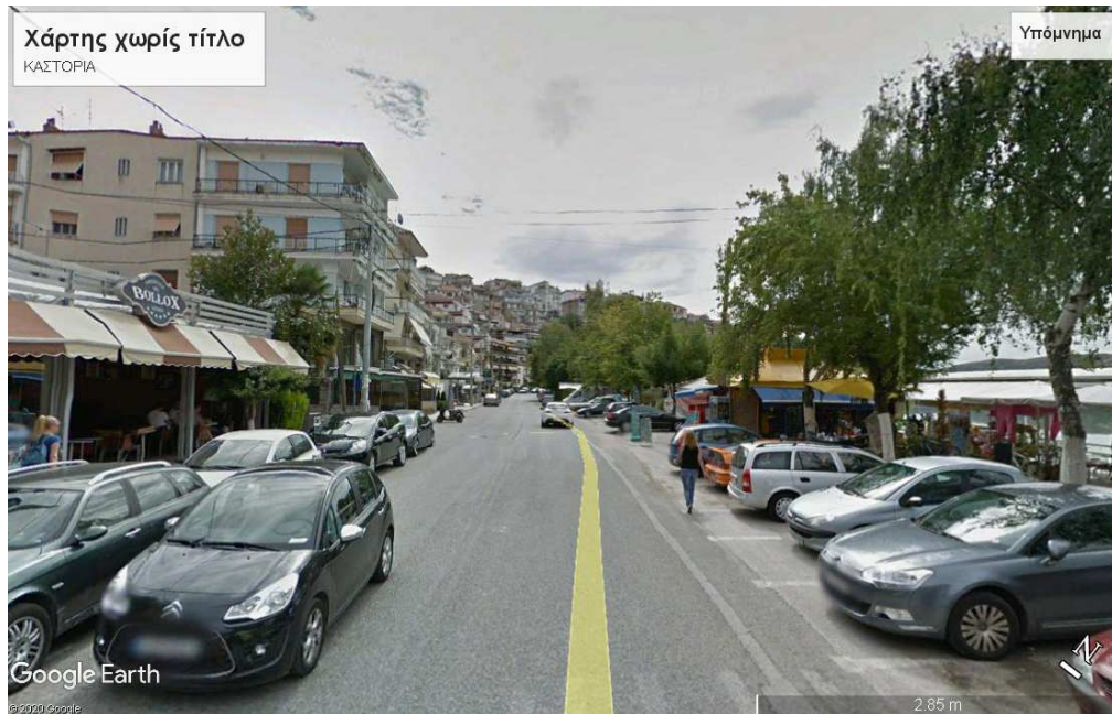
Εικ.2β Το οικιστικό μέτωπο της πόλης της Καστοριάς, επί της οδού Μεγάλου Αλεξάνδρου, στο ύψος του προδιαμορφωμένου χώρου στάθμευσης της οδού. (αριστερά τα καταστήματα εστίασης-αναψυχής και δεξιά το νότιο παραλίμνιο μέτωπο της πόλης)