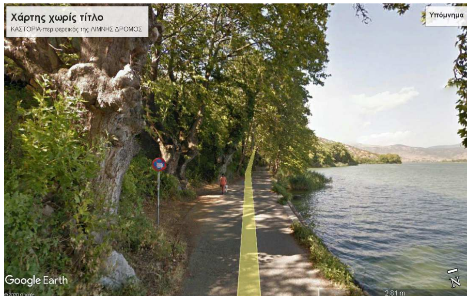
Εικ.2δ1 Ο περιφερειακός της λίμνης δρόμος, η οδός Σουγαρίδη, δε συνέχεια της οδού Μαυριώτισσας.