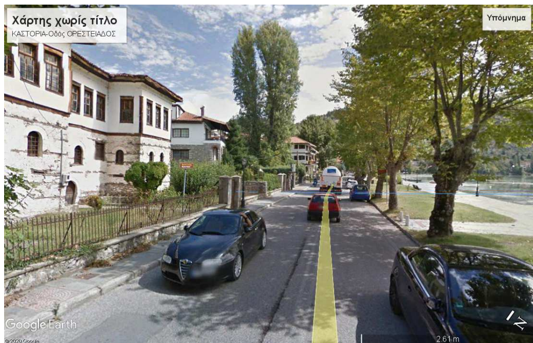
Εικ.2β2 Το οικιστικό μέτωπο της πόλης της Καστοριάς, επί της οδού Ορεστιάδος, -συνέχεια της οδού Μεγάλου Αλεξάνδρου,- που οδηγεί στο Νοσοκομείο της πόλης, στο Μοναστήρι της Μαυριώτισσας και στον περιφερειακό της λίμνης δρόμο.