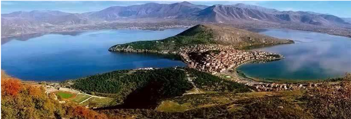
Εικ.1 Πανοραμική άποψη της «χερσονήσου» της πόλης της Καστοριάς και της ομώνυμης λίμνης, που την περιβάλλει.

Η πόλη της Καστοριάς κτισμένη πάνω σε χερσόνησο, ανάμεσα στα βουνά Βίτσι και Γράμμο, περιβάλλεται από την ομώνυμη λίμνη της και συνδέεται με την ξηρά μέσω μιας ευρύτερης λωρίδας γης από επιχωματώσεις, δίνοντας την εντύπωση νησιού.