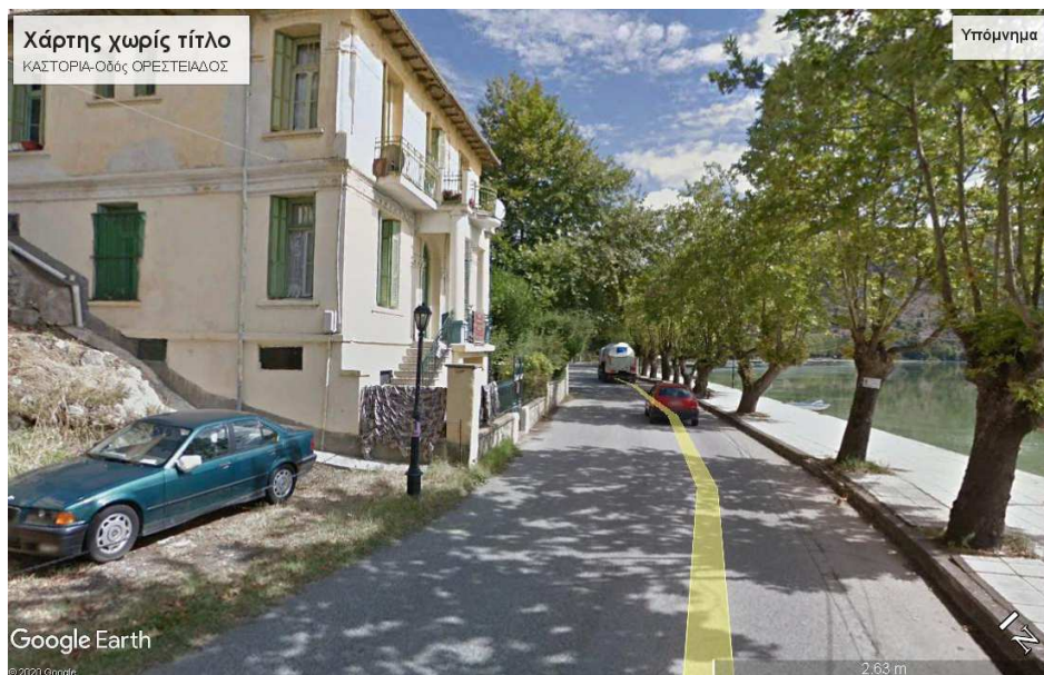
Εικ.2α Το οικιστικό μέτωπο της πόλης της Καστοριάς, επί της οδού Ορεστειάδος-συνέχεια της οδού Μεγάλου Αλεξάνδρου, αμέσως μετά της προγραμματισμένης ανάπλασης του κοινόχρηστου χώρου στη νότια παραλίμνια περιοχή της πόλης.