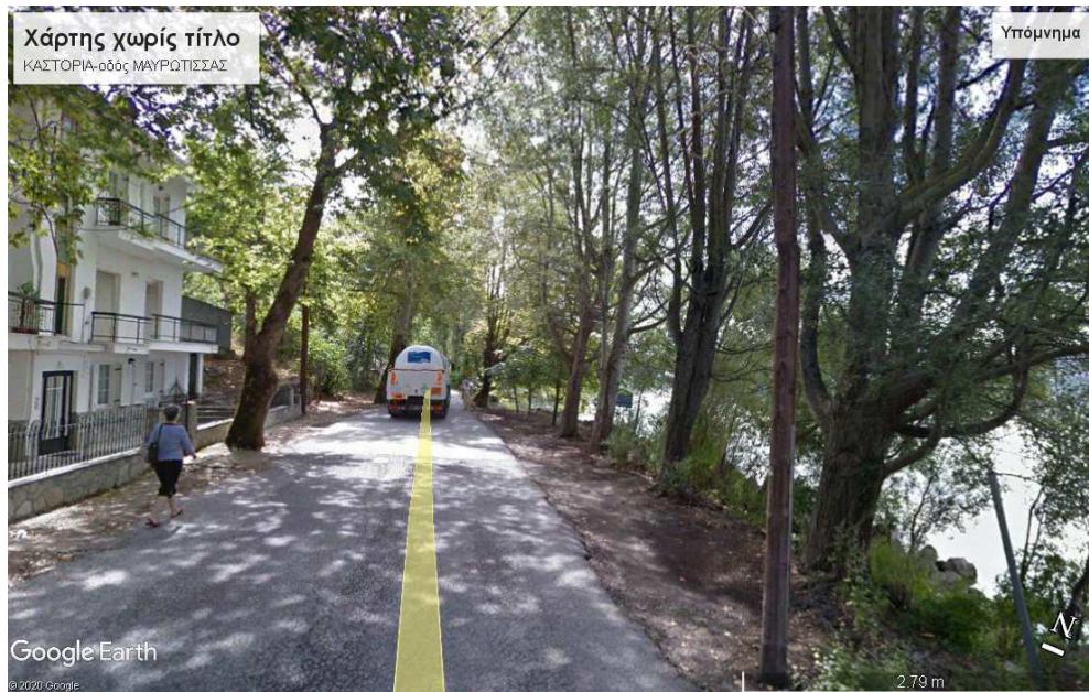
Εικ.2γ Το οικιστικό μέτωπο της πόλης της Καστοριάς, επί της οδού Μαυριώτισσας, -συνέχεια της οδού Ορεστειάδος,- που οδηγεί στο Νοσοκομείο της πόλης, στο Μοναστήρι της Μαυριώτισσας και στον περιφερειακό της λίμνης δρόμο.