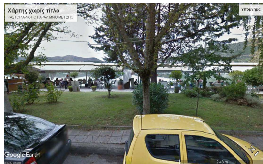
Εικ.5. Οι ελεύθεροι χώροι κυκλοφορίας που έχουν καταληφθεί από καρέκλες και τραπέζια των χώρων εστίασης και αναψυχής των ευρισκόμενων κατά μήκος της Μεγάλου Αλεξάνδρου.