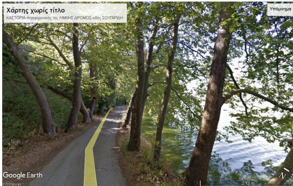
Εικ.252. Ο περιφερειακός της λίμνης δρόμος, η οδός Σουγαρίδη, δε συνέχεια της οδού Μαυριώτισσας.