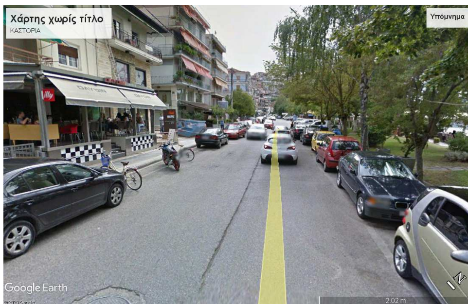
Εικ.2α Οικιστικό μέτωπο της πόλης της Καστοριάς, επί της οδού Μεγάλου Αλεξάνδρου.

Η συνέχεια του δρόμου αυτού, ήτοι η οδός Ορεστιάδος και στη συνέχεια η οδός Μαυρώτισσας οδηγεί στο Νοσοκομείο της πόλης και συνεχίζει σαν περιφερειακός της λίμνης δρόμος, ο οποίος «βάζει» τον επισκέπτη-περιηγητή από την βόρεια πλευρά της πόλης.