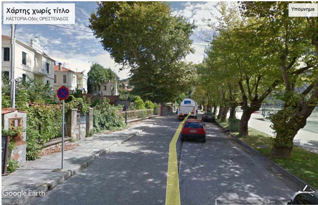
Εικ.2β1 Το οικιστικό μέτωπο της πόλης της Καστοριάς, επί της οδού Ορεστιάδος, -συνέχεια της οδού Μεγάλου Αλεξάνδρου,- που οδηγεί στο Νοσοκομείο της πόλης, στο Μοναστήρι της Μαυριώτισσας και στον περιφερειακό της λίμνης δρόμο.